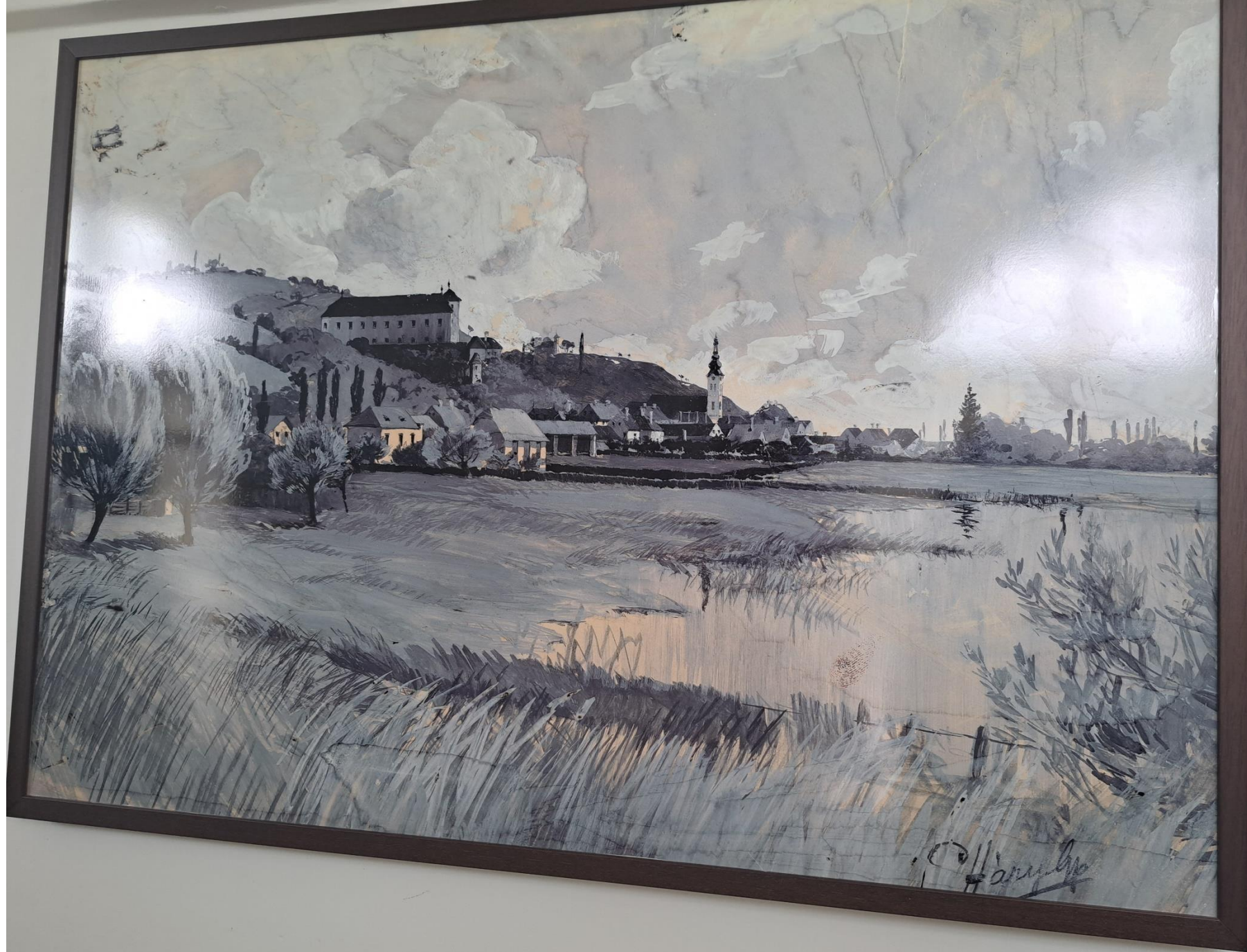
Gyula Hary: Panoram Gyula Hary: Panoram Hary Gyula: Alsóend