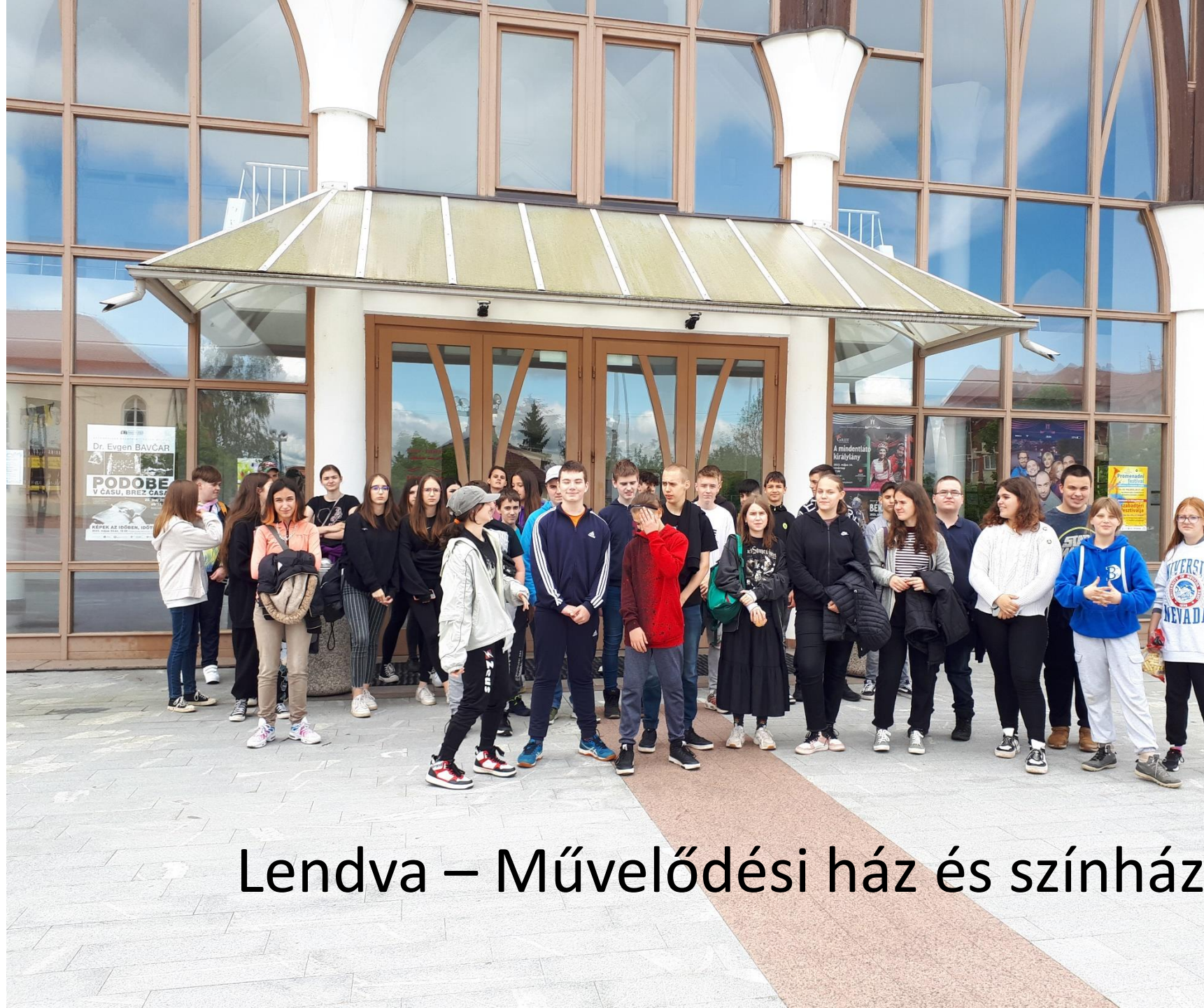
Lendva – Művelődési ház és színház